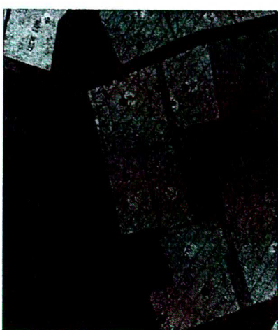
תצלום אוויר מבט מן האוויר

מקום ייחודי - רחוב ארזות מחוז ירושלים ת.ד. 3006 (שומרון) 21.89 מ.ד. 40 שטח התחנה - 7415 מ"ר